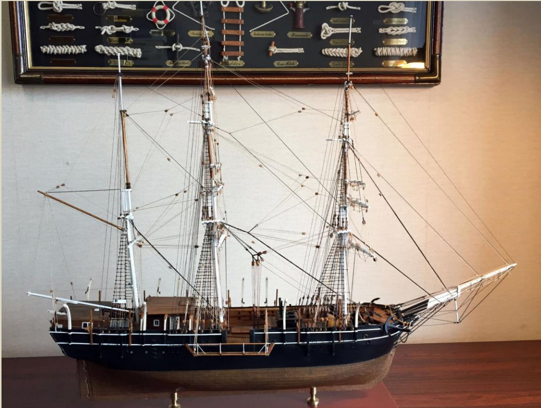
チャールズ・モルガン Charles W. Morgan